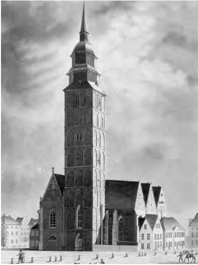
Abb. 1: Federzeichnung der St. Ansgarii Kirche in Bremen um das Jahr 1839