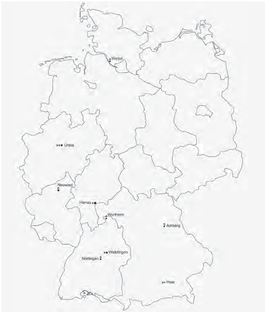
Abb. 1: Standorte der Untersuchungsgemeinden; eigene Darstellung.