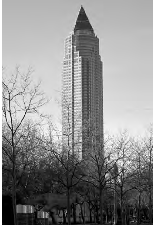
Abb. 2: Frankfurt a. M.: Messeturm; Foto: L. Köhren, 2017.

konsequenterweise die Frage, mit welchen Mitteln es gelingen könne, eine neue Identität für Frankfurt zu generieren, Eingang in das planerische Denken. Der Versuch der Schaffung einer neuen städtischen Identität, welche die Identifikation der Bürger mit ihrer Stadt fördern sollte, bildete daher die entscheidende Komponente bei der städtebaulichen Erneuerung, die in den 1970er Jahren in Gang gesetzt wurde und die zugleich eine Imagekorrektur der Stadt bewirken sollte.