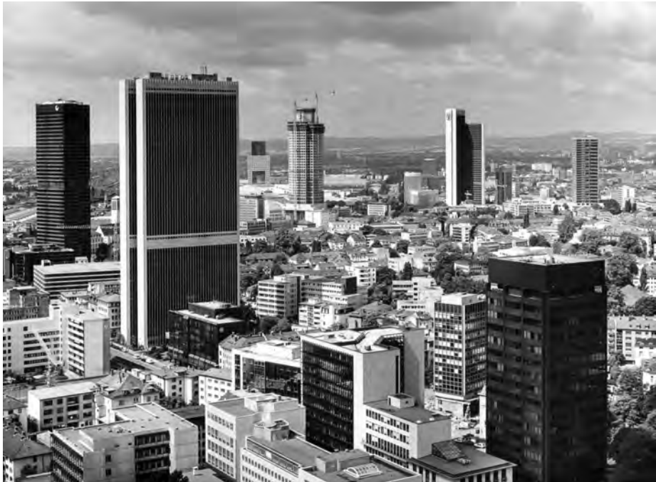
Abb. 6: Blick von der Hessischen Landesbank auf das FBC und das Selmi-Hochhaus; Quelle: Institut für Stadtgeschichte, Frankfurt am Main, S7C Nr. 1998-365, Klaus Meier-Ude.

als die Stadt mit dem Ausbau ihrer Hochhaus-Skyline begann. Bauten von Verwaltungen und Großbanken im Bahnhofs- und Bankenviertel wuchsen zunehmend als Spekulationsobjekte in den Himmel und ließen von den eleganten, amerikanischen Hochhaus scheiben meist nur noch reine Behälterarchitekturen ohne jegliche städtebauliche Einbindung übrig. 1972-75 entstand an der Mainzer Landstraße etwa das von Richard Heil entworfene Frankfurter Büro-Center (FBC) als nüchterner Stahlskelettbau und typisches Scheibenhochhaus (Abb. 6), das als exemplarisch für die Hochhausarchitektur der Nachkriegsmoderne gelten kann, bei den Bürgern der Stadt damals aber stark umstritten war 23 – ebenso wie das mit einer bronzefarbenen Aluminiumfassade ausgestattete City-Haus im Westend, das sich in Farbgebung und Form zweier gleich hoher Scheiben an Mies van der Rohes Seagram Building orientiert und 1971 als Selmi-Hochhaus bekannt geworden ist. Infolge seines in Brand geratenen Rohbaus im Jahr 1973 wurde es gar zum Sym-