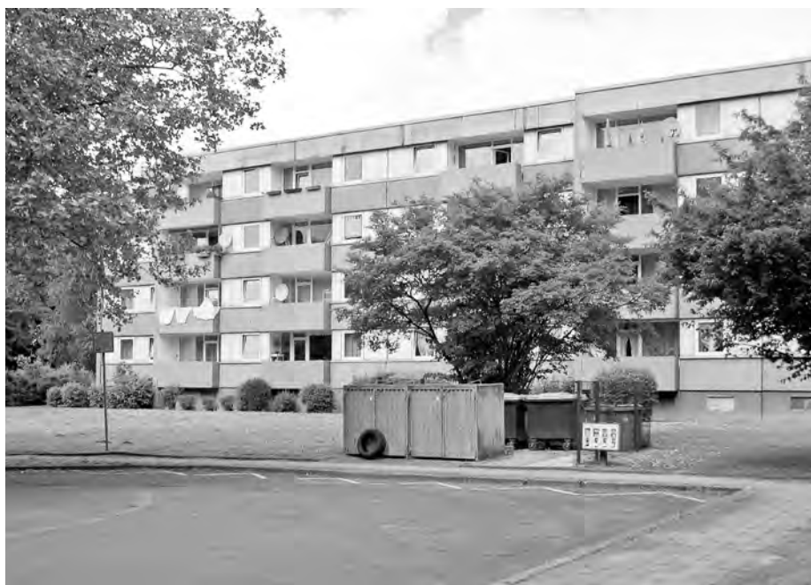
Abb. 6: Unzureichend instandgehaltene Geschosszeile im Besitz privater Einzeligentümer, ebenfalls Unna; Quelle: I. Willnauer .