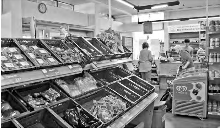
Abb. 4: Das genossenschaftliche ‚Roßdorf-Lädle‘ in der Siedlung Roßdorf in Nürtingen; Quelle: I. Willnauer.

mittlerweile hochgewachsen. Dies macht eine besondere Qualität der Siedlungen aus, führt aber auch dort, wo sie nicht genügend gepflegt und zurückgeschnitten werden, zu einer Verschattung der Südfenster. Auch die ursprüngliche städtebauliche Gliederung der Siedlung durch die Grünflächen ist oft kaum noch spürbar.