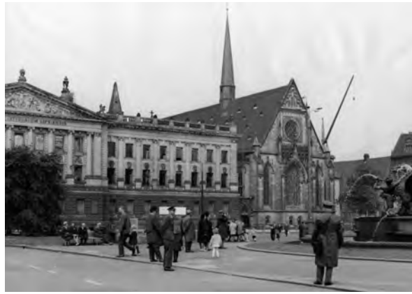
Abb. 2: Die Universitätskirche in Leipzig 1968 kurz vor der Sprengung im Jahre 1968; Quelle: Archiv Bürgerbewegung Leipzig e. V.

Für die Städte Leipzig und Bremen waren diese beiden Kirchenabrissse keine Einzelfälle. 5