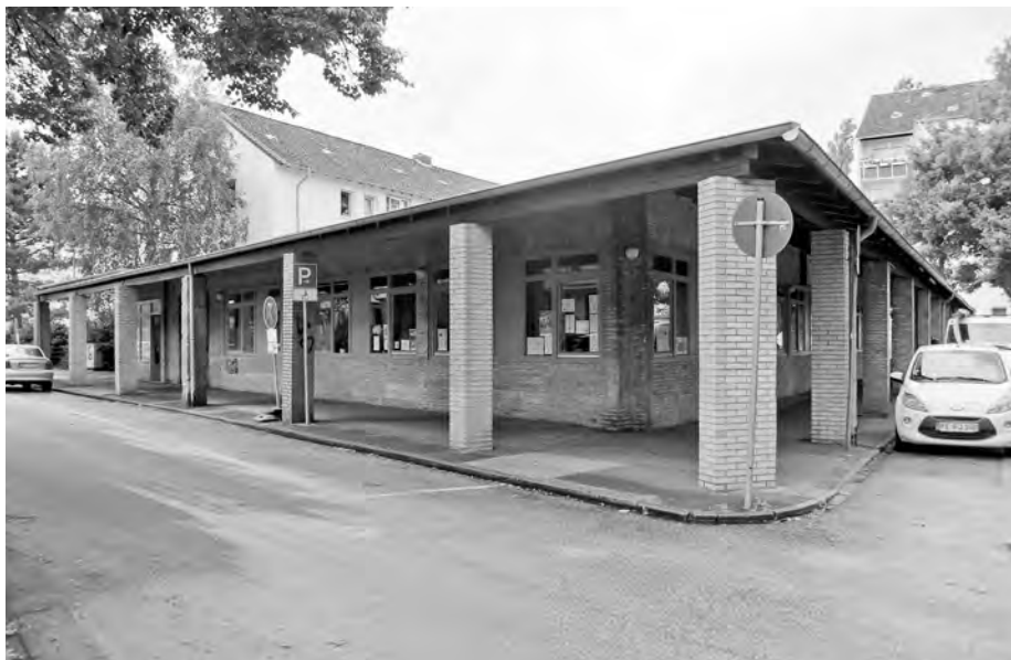
Abb. 11: Stadtteilzentrum in der Gartenstadt Elbhochufer, Wedel (gebaut 1990); Quelle: I. Willnauer.

wie sie in vielen Großsiedlungen der Großstädte inzwischen Standard sind. Auch Standorte für Car-Sharing und Mietfahrrad-Stationen oder ähnliche neuere Mobilitätskonzepte in Quartieren gibt es bisher nicht.