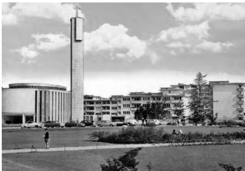
Abb. 7: Ansichtskarte der Siedlung Neu-Isenburg Gravenbruch

zung genießt etwa das als Bundesdemonstrativbauvorhaben errichtete Sebastiansviertel in Amberg, das die Bewohner bis heute in Anlehnung daran liebevoll „D-Programm“ nennen. In den letzten 15 Jahren hat sich die Außenwahrnehmung nach Auskunft der lokalen Experten vielerorts wieder verbessert. Sie führen dies auf die bessere Integration der Migranten und auf die diesbezüglichen Anstrengungen der sozialen Einrichtungen und ihre passgerechten Angebote zurück.