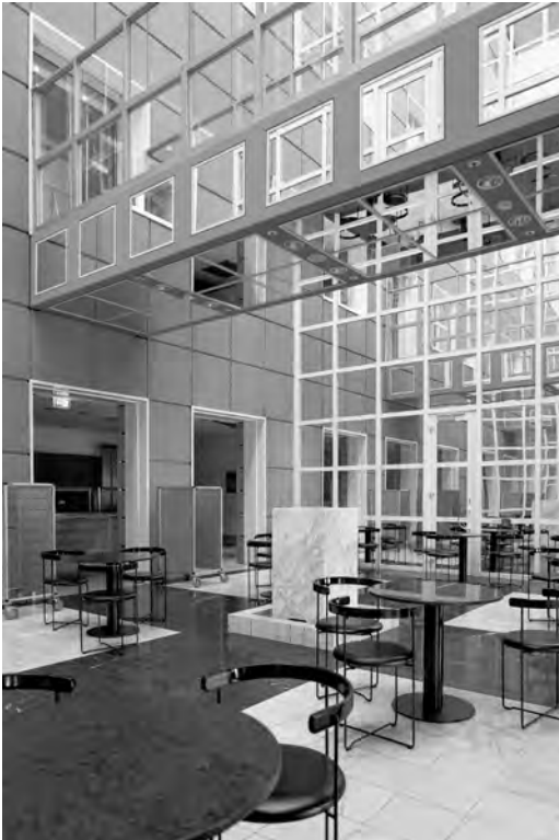
Abb. 4: Torhaus, Café Fontana; Quelle: Ekkehard Mantel.

sche Symmetrie dem Bauwerk jedoch eine Ausgeglichenheit, die auch auf der durchdachten Balance zwischen Vertikalen und Horizontalen basiert, dem Gebäude jedoch nichts von seiner insbesondere durch die massive Sandsteinverkleidung hervorgerufenen Monumentalität nimmt.