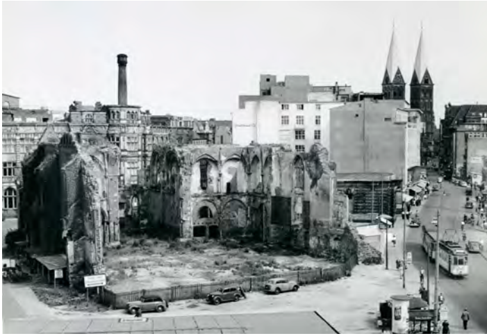
Abb. 4: Die St. Ansgarii-Ruine kurz vor ihrem Abriss Ende der 1950er, Foto: Karl Edmund Schmidt, Quelle: Staatsarchiv Bremen 10,B-1960-102.

scheiterten letztlich am Geld. Dies verdeutlicht den großen Einfluss der Wirtschaft auf den westdeutschen Wiederaufbau, der von Stadtplanern – auch in Bremen – kritisiert wurde. 14