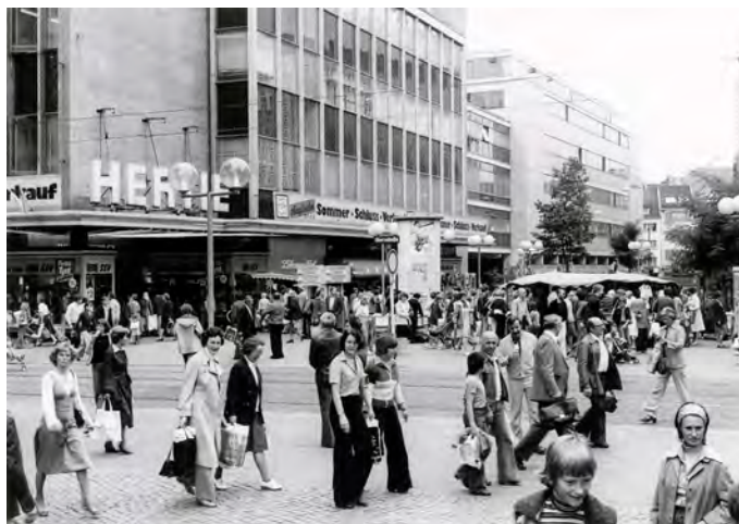
Abb. 5: Das Warenhaus Hertie während des Sommerschlussverkaufs im Jahr 1977