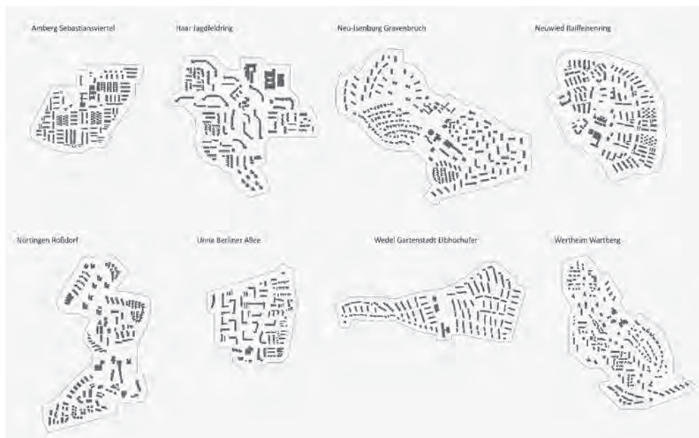
Abb. 2: Schwarzpläne der Fallsiedlungen; eigene Darstellung.

In Amberg, Wedel und Wertheim liegen 10 % des kommunalen Gesamtwohnungsbestandes in den jeweiligen Großsiedlungen. In Neu-Isenburg und Haar fällt der Anteil mit bis zu 30 % besonders groß aus.