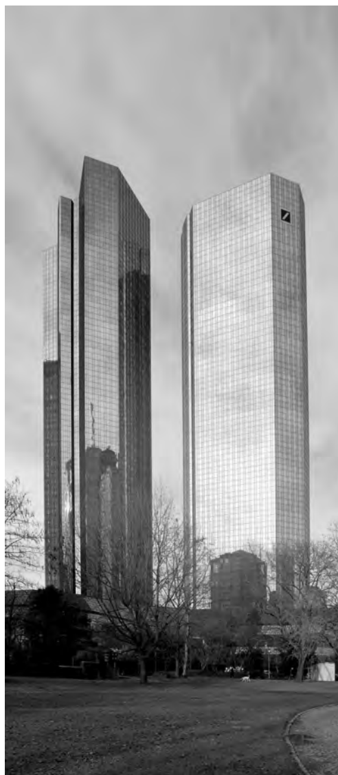
Abb. 7: Frankfurt a. M.: Türme der Deutschen Bank, Ansicht von der Taunusanlage; Foto: L. Köhren, 2015.

Die Verwendung der klassischen Hochhauscheibe bei Ungers kann vor diesem Hintergrund zunächst als Referenz an die internationale Hochhausgeschichte gelten, die ihm mit berühmten Vertretern wie dem Seagram Building als Vorbild für eine der Moderne verpflichteten Architektur dient. Zugleich weist Ungers' Turm in Form eines gläsernen Rechtecks dezidiert auf das moderne Frankfurt der der 1960er und 1970er Jahre, als Hochhäuser überwiegend negativ konnotiert waren und sie als Beispiele eines geschichtsvergessenen Städtebaus des sogenannten Bauwirtschaftsfunktionalismus angeführt wurden. Dennoch dienen sie Ungers als Bezugspunkt, um den Unterschied zu einer neuen, erzählerischen Architektur noch deutlicher vor Augen zu führen. Der rechteckige Baukörper aus rotem Betonwerkstein schließlich zitiert den typischen Mainsandstein des historischen Frankfurt des 19. Jahrhunderts. Die