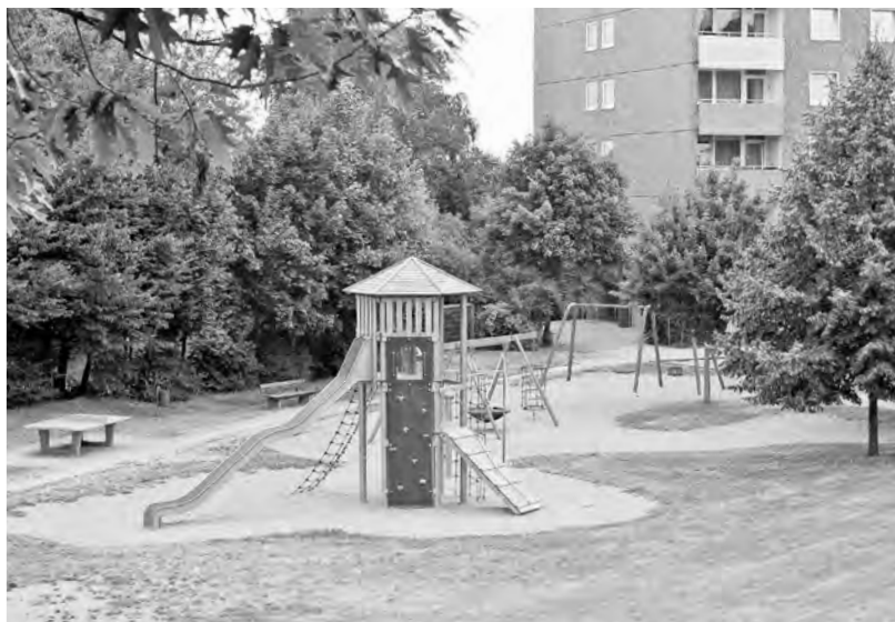
Abb. 8: Erneuerter Kinderspielplatz in Wertheim; Quelle: I. Willnauer.

Beispiel Freiflächen: In der Regel wurden die öffentlichen Spielplätze saniert und Spielgeräte erneuert (Abb. 8). Unterschiedliche Auffassungen der Freiraumgestaltung und -pflege werden in der Intensität sichtbar, mit der das ursprüngliche Konzept fließender Freiräume und sonnenbeschienener Fassaden durch Zurückschneiden der Vegetation aufrecht erhalten wird. Manche halten Sichtachsen frei, andere lassen die Siedlung „verwalden“. Weitreichendere Umgestaltungen der Grünräume durch Umnutzung sogenannter Abstandsflächen zu Mietergärten oder neue Formen des „Urban Gardening“ werden nur punktuell verfolgt. Insgesamt jedoch vermitteln die grünen Freiflächen in allen Siedlungen als Ganzes einen gut gepflegten Eindruck – mit nur wenigen Ausnahmen im Umfeld einiger untätiger Wohnungsbaugesellschaften.