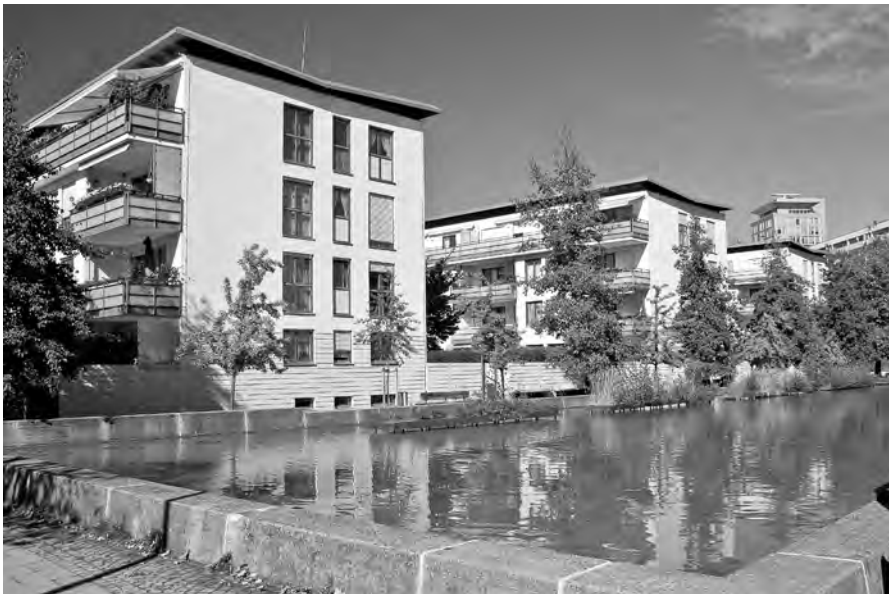
Abb. 10: Neue Mitte in Haar Jagdfeldring mit Ziersee (2004-2008)