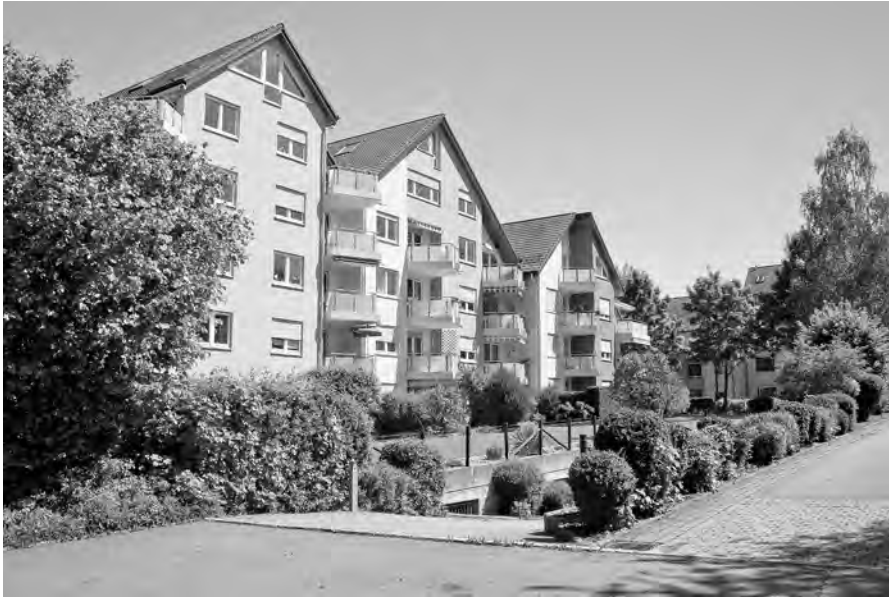
Abb. 9: Erweiterung der Siedlung durch Wohnungsbau in Nürtingen Roßdorf in den 1980er Jahren