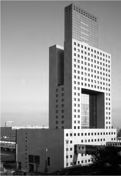
Abb. 1: Frankfurt a. M.: Messe, Torhaus; Quelle: Bildarchiv Foto Marburg / Waltraud Krase.