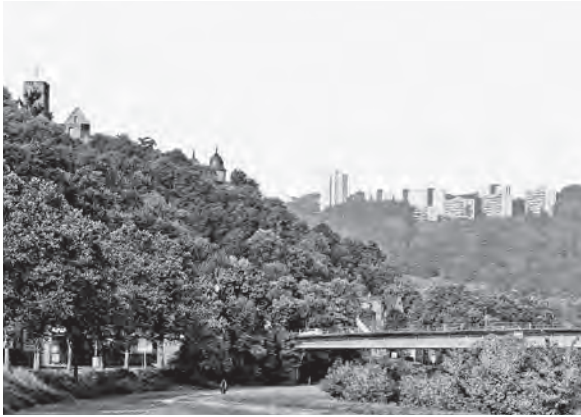
Abb. 3: Siedlung Wartberg in Wertheim; Quelle: I. Willnauer .

Man ist in den Nachkriegsjahren keineswegs immer diesem Ideal des Trabanten gefolgt, sondern vernetzte die neue Siedlung eng mit dem bestehenden Stadtgefüge, so in Neuwied und in Amberg. Ob dies aus einem nicht weiter reflektierten Pragmatismus heraus geschah oder man sich bewusst gegen das damalige dominante Konzept des Trabanten positionierte, lässt sich nicht mehr feststellen.