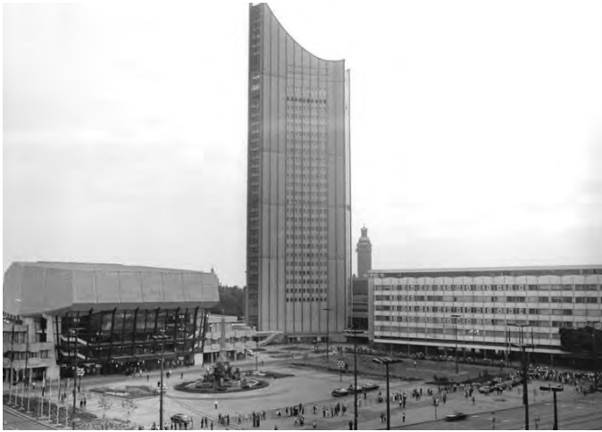
Abb. 3: Leipzig, Karl-Marx-Platz; Neues Universitätshochhaus 1982

dieser Reihe einzuordnen war, lag auf der Hand. Außerdem wollte man sich auch hier dezidiert von der zu dieser Zeit im Westen etablierten Praxis des Bauens von Universitäten am Stadtrand abgrenzen. 10