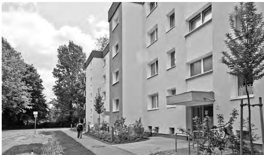
Abb. 5: Umfassend sanierter Geschosswohnbau des Bau- und Sparvereins Dortmund eG in der Berliner Allee, Unna