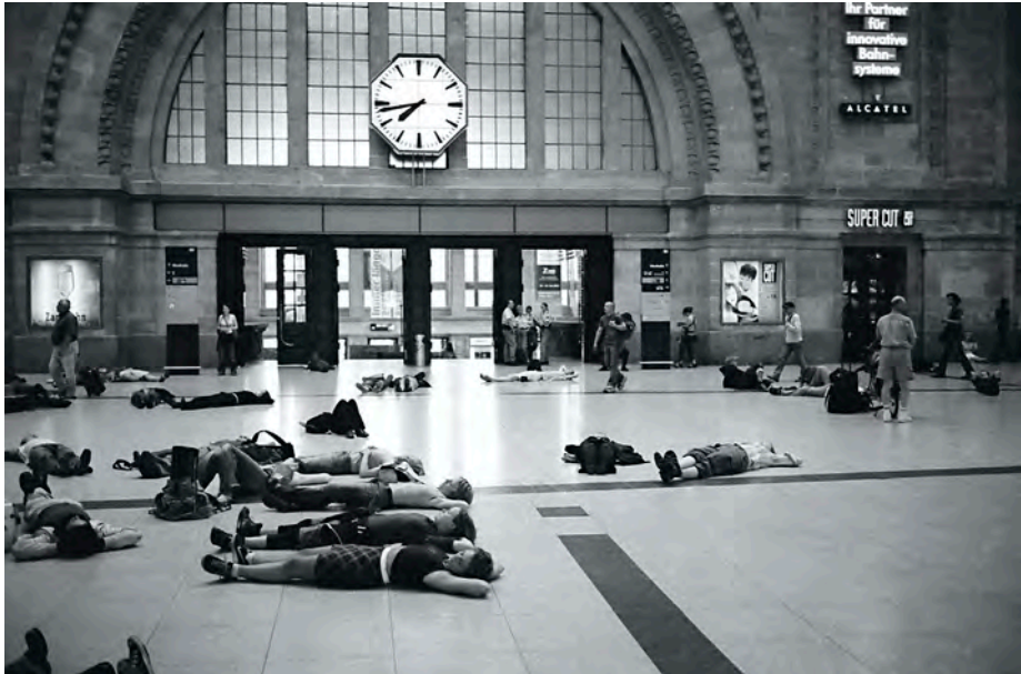
Abb. 1: Projekt Radioortung – Deutschlandfunk Kultur;