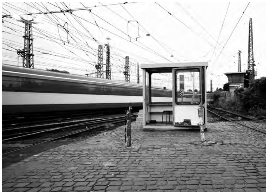
Abb. 2: Verkehrsinfrastrukturen als urbane Lebensadern; Foto: J. Hasse.

gen anders gestimmt als am Mittag, am Abend, in der Nacht oder im Gedränge der Rushhour.