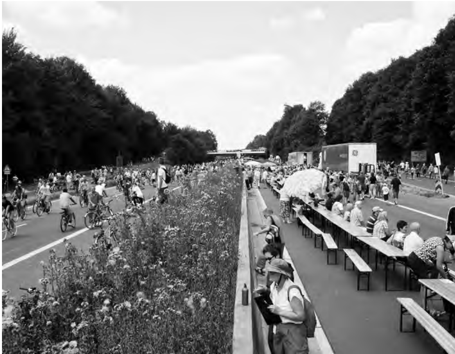
Abb. 2: Mitglieder des Bochumer Botanischen Vereins nehmen die Flora des Mittelstreifens der A40 genau unter die Lupe während sich Fahrradfahrer und Fußgänger die Fahrspuren teilen. Um 12 Uhr Mittags gab es 15 km „Fahrradstau“

strukturprojekten zugeschrieben und überlassen, dabei zeigen die oben genannten Beispiele, wie schon veränderte Bewegungsströme und Nutzungsweisen Orte atmosphärisch gänzlich transformieren können. Architektonisches Handeln kann durch Bauen geschehen, aber eben auch durch Laufen. Gehen ist nicht nur ein ephemeres Geschehen, sondern auch eine Intervention, die Spuren hinterlässt. 7 Für seine Skulptur „A Line Made by Walking“ läuft Richard Long geradeaus durch ein Feld und fotografiert die sichtbare Linie. 8 Die Spur im Gras zeigt, wie Bewegungen Landschaften und prägen und wie Laufen eine Form von Ortsgestaltung und Architektur sein kann.