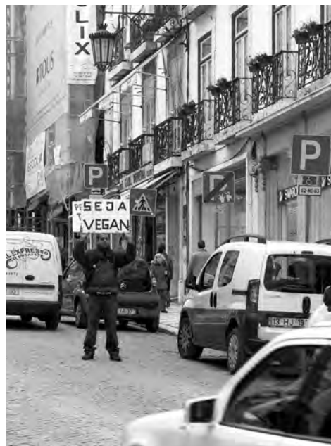
Abb. 4: Bewegung als politischer Ausdruck; Foto: J. Hasse.

Alle technischen Modi der Fortbewegung verdanken sich dem technischen Fortschritt. Um die Mitte des 19. Jahrhunderts bewirkt die Erfindung der Eisenbahn eine radikale Veränderung in der massenhaften Bewegung der Menschen. „Bald erscheint ihnen (den Verkehrsteilnehmern, J.H.) nicht mehr die gleichförmig-schnelle Bewegung der Dampflokomotive gegenüber der durch Zugtiere hergestellten als das Unnatürliche, sondern umgekehrt: die mechanische Gleichförmigkeit wird ihnen die neue Natur, der gegenüber die Natur der Zugtiere als gefährliches Chaos erscheint.“ 49 In der Gegenwart implizieren die Verkehrstechnologien eine Fußnote zum Stand gesellschaftlich regulierter Mensch-Natur-Verhältnisse. In unserer Zeit soll insbesondere das „Elektroauto“ einen Beitrag zur Schonung der natürlichen Ressourcen leisten, gleichwohl eher im Sinne einer symbolischen Geste, ist die Idee und Praxis der sogenannten Elektro-Mobilität doch in erster Linie PR-Medium einer „grünen“