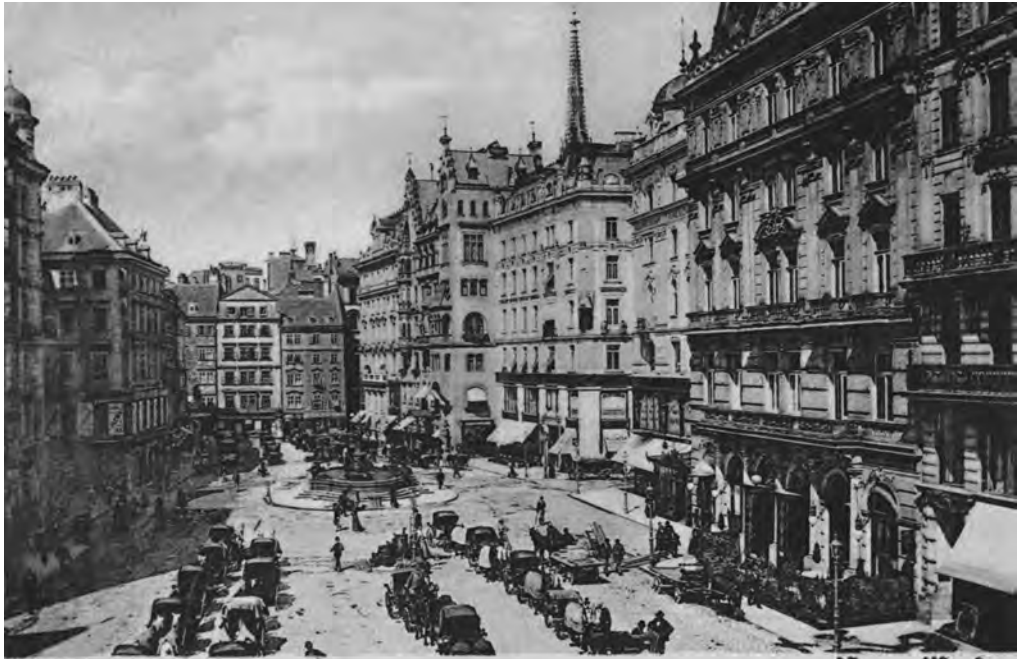
Abb. 2: Wien, Neuer Markt; Postkarte um 1900.

sich dann unter anderem darin niedergeschlagen habe, dass „Wien um 1900 als einzige Metropole Europas die weltweite Einführung der neuen Zeitzonen nur widerwillig und mit auffallender Verzögerung vollzog“. 22 Neben dem Katholizismus ist hier die höfische Prägung der Wiener Stadtgesellschaft ein ausschlaggebender Faktor; so ist ein Kapitel des Ausstellungskatalogs dem „Kaiserhof als Taktgeber der Wiener Zeitordnung“ 23 gewidmet.