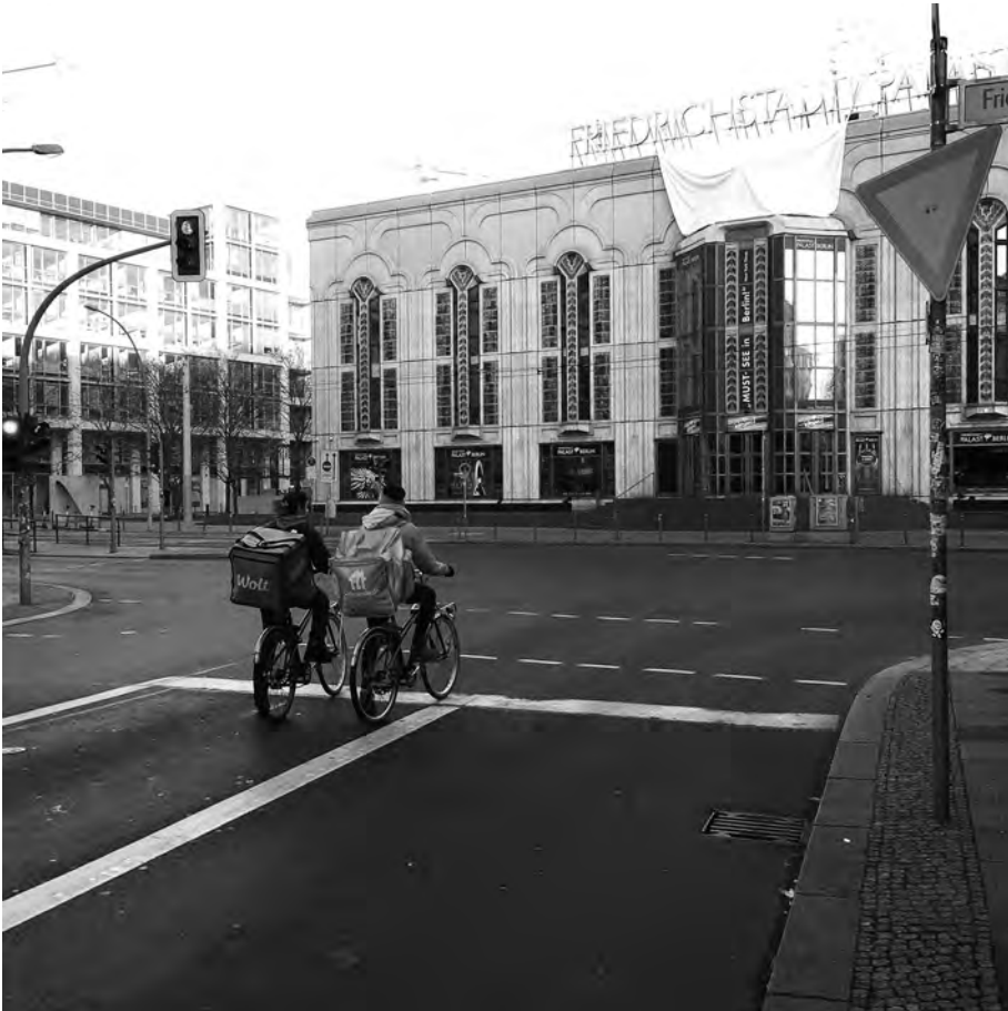
Abb. 3: Lockdown ist Lieferzeit. Die Fahrradkuriere wirken mit ihren Neon Uniformen seltsam deplatziert vor den dunklen Fenstern der geschlossenen Theaterbühne Friedrichstadt-Palast; Foto: Valentin Ihßen.

men. Doch nicht immer sind die neuen Verhandlungen um Stadtraum so harmonisch. In Lopburi in Thailand herrscht im Lockdown eine urige Ausnahmesituation in der Stadt: Die Affen, die normalerweise von Touristen und Anwohnern gefüttert wurden, leiden an einer Fütterungspause und zeigen sich hungrig und aggressiv. Auf der Suche nach Nahrung plünderten die Affenbanden Geschäfte, Transporter und griffen Personen auf offener Straße an. Die ursprünglich wilden Tiere hatten sich in Lopburi an den gleichmäßigen Rhythmus von Fütterungen mit Bananen und Hamburgern gewöhnt, sodass sie verlernten, sich selbst um ihre Nahrungsbeschaffung zu