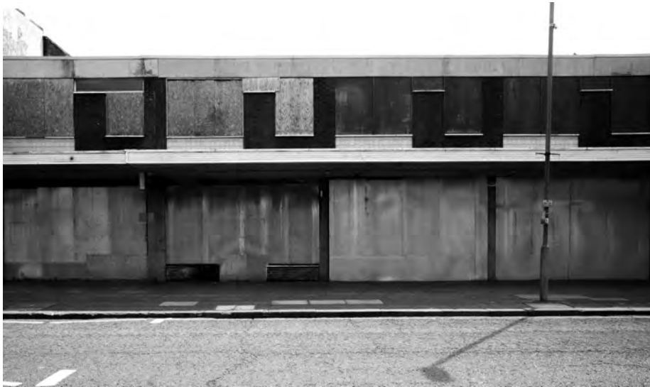
Abb. 3: Am Ende aller Bewegung; Freeman Street Grimsby (GB); Foto: J. Hasse.

und der postmortalen Unbewegtheit der Toten. Gleichsam „zwischen“ der hypervitalen City und dem thanatologischen Raum des Friedhofs breiten sich die Interferenzen des Urbanen im vitalen Leben aus. Ein lebender Mensch verändert sich in Prozessen seines natürlichen und sozialen Werdens; 15 ebenso verändert er seine herumwirkliche Welt. Auch der Raum der Stadt wandelt sich in einer antinomischen Bewegungsdynamik, einer Spannung zwischen lebendigem Wachstum (sozial wie architektonisch-städtebaulich) und postmortalem Verfall am Ende der Geschichte (relativer Stillstand von allem Menschgemachten). Die Stadt ist ein chaotischer Kosmos permanenter Übergänge. Diese ereignen sich zwar auch in der Peripherie der vom Fortschritt übergangenen Dörfer, jedoch in einem ganz anderen sozialen und technologischen Rhythmus.