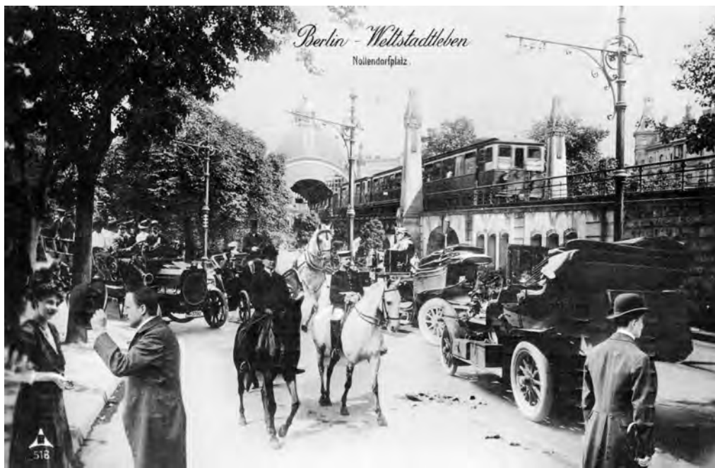
Abb. 1: Berlin – Weltstadtleben , Postkarte um 1900.

Berliner als „von ihrer eigenen Motorik beherrscht“ vorgestellt werden? Und wie ist Berlin überhaupt zum Idealtypus der „schnellen“ und „hektischen“ Stadt geworden?