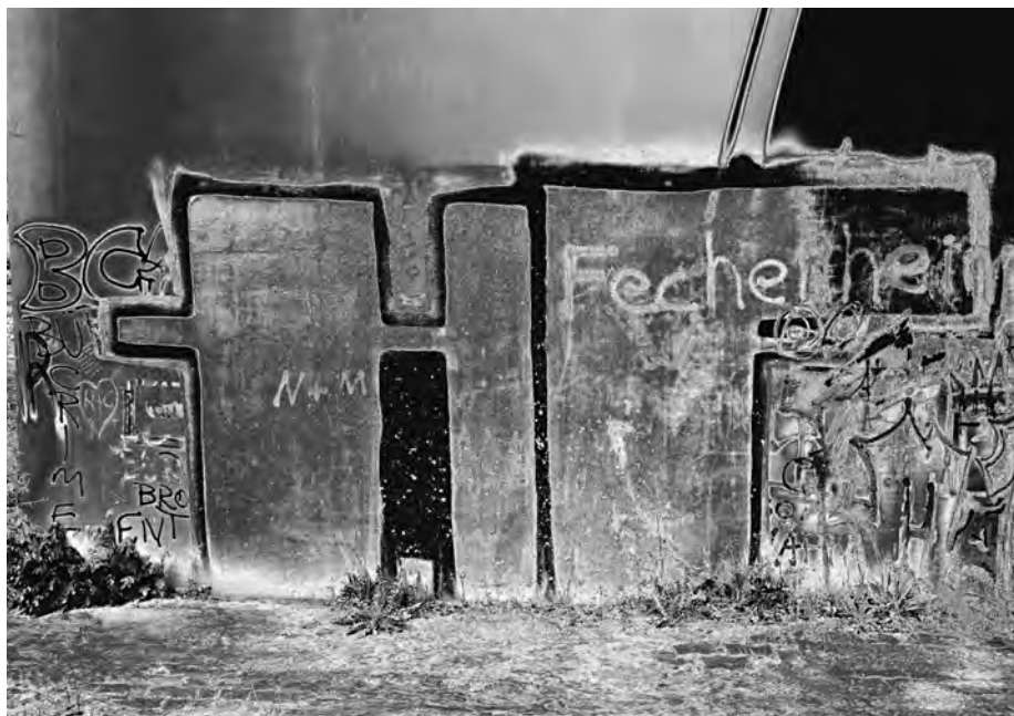
Abb. 1: Graffiti als Ausdruck sozialer Bewegtheit

sie gesellschaftliche Realität und situative Wirklichkeit ins Imaginäre transformieren. Viertens: Für die New Yorker Philharmoniker schreibt der amerikanische Komponist George Gershwin im Jahre 1928 die Auftragskomposition Ein Amerikaner in Paris , mit der er seine Reiseeindrücke musikästhetisch in ein Klangbild überträgt. Er komponiert nicht nur Musik, sondern mit auditiven Mitteln vor allen Dingen synästhetische Eindrucksqualitäten, die die Menschen in ihrer emotionalen Bewegtheit stimmen. Alle vier Bewegungsbilder zeichnen mit ästhetischen Mitteln Spuren urbaner Lebendigkeit nach. Sie entziehen sich der Quantifizierung; sie spiegeln emotionale Situationsverwicklungen wider, deren Thematisierung in der Wissenschaft üblicherweise nicht stattfindet. Quelle der Aufmerksamkeit ist jeweils die mitfühlende Teilhabe am mehrdimensionalen urbanen Bewegungsgeschehen. In der atmosphärischen Verbildlichung rückt (mit metaphorischer und synästhetischer „Genauigkeit“) ein facettenreiches menschliches Treiben und Sein in den Fokus, das nur zufällig auch den Charakter eines planvollen Handelns von „Akteuren“ hat.