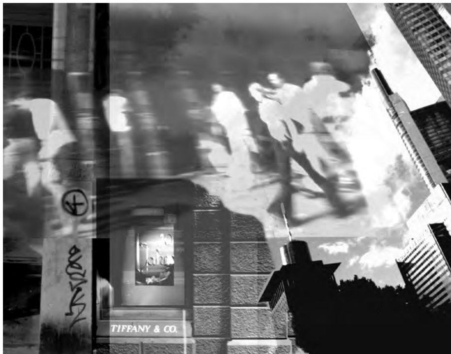
Abb.: Bewegung situiert die Menschen im Raum der Stadt; Foto: J. Hasse.

Stadt gehören ebenso Tiere und Pflanzen, ziehende Wolken und heran- wie wegwehende Geräusche und Gerüche. Mit anderen Worten: Der Leib der Stadt „atmet“ in einem metaphorischen Sinne und stimmt durch seine Rhythmen das Ergehen seiner Bewohner und Benutzer. Bewegung situiert die Menschen im Raum der Stadt, wie die Politik der Stadt und die Macht der Ökonomie die Menschen im Hinblick auf bestimmte Bewegungsmuster situieren. Der Beitrag votiert für die Bewusstmachung aller Implikationen und Schattenzonen individueller und kollektiver Bewegung. Indem die Sicherung der Lebensstandards allzumal in der westlichen Welt hohe Bewegungsinterferenzen voraussetzt, müssen vor allem jene Formen der Bewegung, die soziale und ökologische Ressourcen beanspruchen, auch zu einer Sache der politischen und ethischen Legitimation werden.