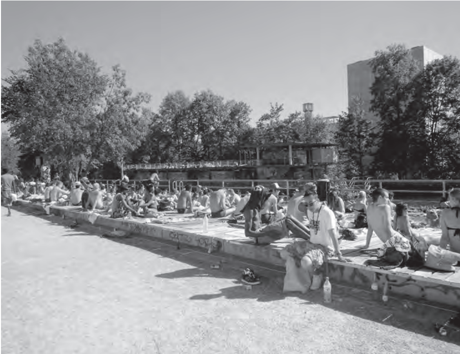
Abb. 3: Naherholungszone Limmatufer, Zürich.

Straßenraum hinein erweitert. Damit ist ein multifunktionaler Raum entstanden, der zu bestimmten Zeiten Pausenhof ist, der aber auch Quartiersplatz mit Spiel- und Sitzmöglichkeiten und zugleich verkehrsberuhigter Transitraum ist (vgl. Abb. 4). Von dieser Multifunktionalität profitieren alle, denn sie generiert Begegnungen unterschiedlicher Menschen, die andernorts selten in Kontakt kommen. Und dies sollte zentrales Anliegen öffentlich zugänglicher Räume bleiben: Raum zu bieten für Begegnungen von Menschen unterschiedlicher Herkunft und Ethnien, Milieus und Schichten, Altersklassen und körperlicher Mobilitäten.