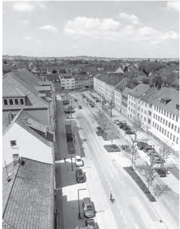
Abb. 1: Verkehrsraum einmal anders: Rosenplatz, Osnabrück; Foto: lad+ , Hannover.

ließe sich unendlich fortsetzen. Allein wenn diejenigen Stadträume betrachtet werden, in denen Handels- und Marktfunktionen dominant sind, sind große Unterschiede zu finden: Der Platz um das Freiburger Münster hat zu Wochenmarktzeiten zum Beispiel kaum etwas gemein mit Einkaufsstrassen alter Ruhrgebietsstädte oder neu gestalteten Shopping Malls, die sich in vorhandene Stadtstrukturen einfügen. Nicht weniger groß ist die Vielfalt von Räumen, die der Bewegung vorbehalten sind. Auch hier sind große gestalterische Unterschiede zu finden: Wurden vor Jahren die Bahnhofsvorplätze vieler Städte neu gestaltet und zu einladenden Entrees verwandelt, so stehen neuerdings vermeintlich banale Straßenräume auf der Agenda von Gestaltern. So beweisen Projekte wie zum Beispiel der Rosenplatz in Osnabrück, dass Verkehrsraum trotz zahlreicher verkehrlicher Anforderungen auch qualitätsvolle Aufenthaltsräume sein können (vgl. Abb. 1).