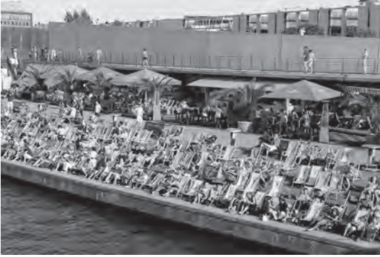
Abb. 7: Strand am Bundeskanzleramt, Berlin 2013; Foto: W. Kaschuba.