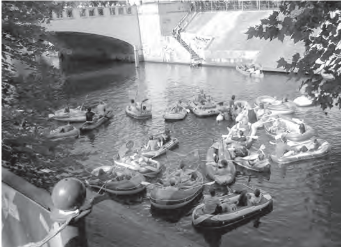
Abb. 11: Schlauchboote auf dem Kanal, Berlin 2013; Foto: W. Kaschuba.