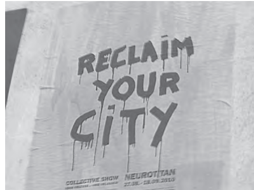
Abb. 14: Reclaim your City – Berlin 2013; Foto: W. Kaschuba.

Jedenfalls empfiehlt es sich am Ende des Tages, in der „Kampfzone Stadtmitte“ und im dort oft heftigen „Kampfgetümmel“ stets auch die radikale Alternative dazu mit zu bedenken: die Altstadt und die Stadtmitte als touristisches „Geronto-Top“ oder als altdeutsche „Nachtwächter-Stadt“. Das klingt dann auch nicht wirklich nach Urbanität und Utopie.