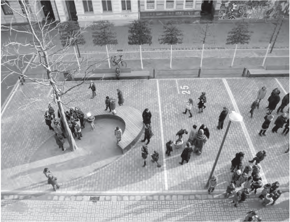
Abb. 4: Schul-Straßen-Quartiersraum Corneliusstraße Krefeld; Foto: DTP Landschaftsarchitekten .

gen sind. Während es in der Fachdebatte lange Zeit so klang, als seien öffentlich zugängliche Räume immer auch „öffentliche“, unter Eigentums- und Verfügungsrecht der Kommune stehende Räume, hat das an der RWTH Aachen durchgeführte und von der DFG finanzierte Forschungsprojekt „STARS – Stadträume in Spannungsfeldern. Plätze, Parks und Promenaden im Schnittbereich öffentlicher und privater Aktivitäten“ etwas anderes deutlich gemacht. 1 Das Spektrum von Akteuren, das die Entwicklung und Instandhaltung von Stadträumen (mit)prägt, ist breit: Zunächst sind es die kommunalen Planer aus der Verwaltung, insbesondere aus Planungs-, Grünflächen- und Tiefbauämtern. Sie bringen ihre jeweilige fachliche Sichtweise ein, die von Amt zu Amt durchaus divergieren kann. Schon das Zusammenspiel dieser unterschiedlichen kommunalen Akteure ist nicht immer leicht und unkompliziert. In den meisten Fällen sind die kom-