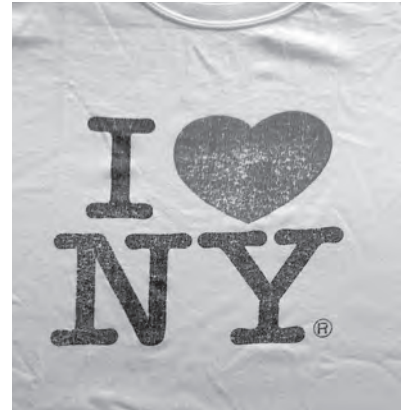
Abb. 5: I love NY, T-Shirt Berlin 2013

licht Jane Jacobs ihre düstere Diagnose „The Death and Life of Great American Cities“. 9 1971 fordert der Deutsche Städtetag verzweifelt: „Rettet unsere Städte jetzt!“ Und im selben Jahr taucht in New York ein T-Shirt mit dem Logo auf: „I love New York“ (vgl. Abb. 5). Heute kennen es alle und viele tragen es – inzwischen oft verziert mit dem Logo ihrer eigenen Stadt. Doch die meisten wissen nicht oder haben vergessen, dass das Original damals keineswegs für den heutigen hippen Big Apple warb, sondern dass es der Hilferuf einer sterbenden Stadt war, formuliert von einer Künstlergruppe als pathetischer Appell: „Zieht hier nicht weg! Kapitulierte nicht einfach vor Verkehr, Verfall, Beton, Kriminalität!“