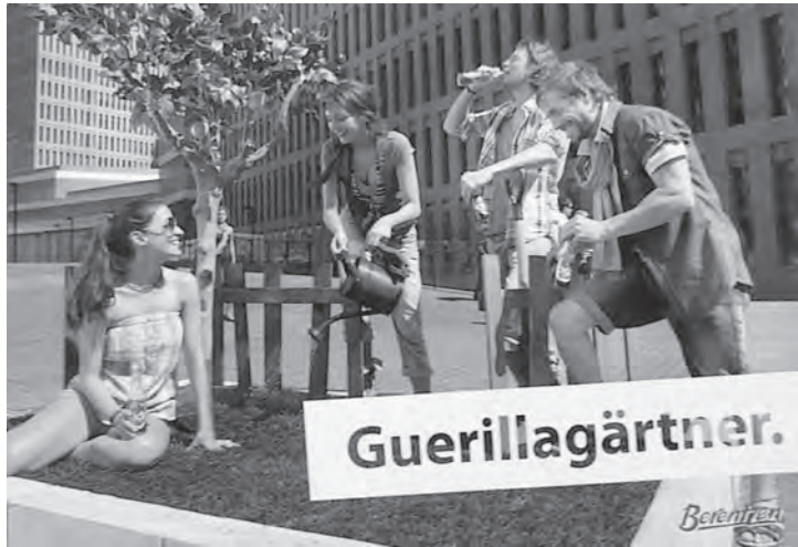
Abb. 10: Guerilla Gärtner, Postkarte; Foto: Berentzen .

Gardening-Projekte. Letztere vor allem gedeihen mittlerweile von Konstanz bis Flensburg als ideologisch wie ökologisch beschworener städtischer Rettungsring, der jedenfalls mehr Grün, mehr Gärtner und mehr Gurken verspricht. Denn auch hier ist beides am Werke: intensives Engagement wie kreative Ironie (vgl. Abb. 10). Auch die Gemeinschaftsgärtner selbst ziehen immer wieder feine und oft ironische Grenzlinien zwischen sich und den traditionellen Schrebergärtnern oder den stylishen Town House-Begrünern: Sie seien schließlich „grüne“ Zivilbürger, nicht in der Wolle gefärbte Spießbürger.