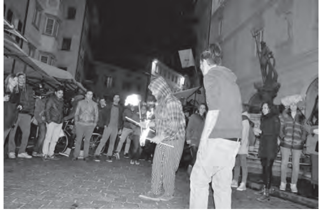
Abb. 7: Projekt »Freunde der Nacht« am Obstplatz in Bozen; Quelle: Forum Prävention .

den Maturabällen zu gewinnen, um für die Einhaltung der „10 Punkte für Feiern mit Niveau“ zu werben.