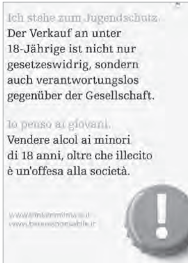
Abb. 3: Aufkleber zum Jugendschutz

dem Südtiroler Gemeindenverband im Auftrag des Ressorts für Familie, Gesundheit und Sozialwesen entwickelt. Neben Informationsmaterialien enthält es konkrete Maßnahmenvorschläge auf Gemeindeebene für Feste und Bälle (Beispiel einer Standardlizenz für Feste, Musterverordnung im Bereich Alkohol) sowie für den Jugendschutz. Interessierte und motivierte Gemeinden können sich beim „Forum Prävention“ melden, um das Kit von einem Präventionsmitarbeiter im Rahmen einer Gemeindeausschusssitzung überreicht zu bekommen. Etwas mehr als die Hälfte aller Gemeinden haben bis zum heutigen Zeitpunkt das „Gemeindekit“ erhalten (vgl. Abb. 1).