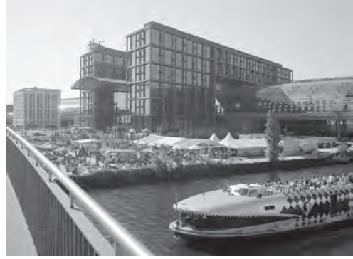
Abb. 8: Am Berliner Hauptbahnhof 2013, Berlin; Foto: W. Kaschuba.

So etwas bietet nicht einmal Rio. Und das Motto dieser Mediterranisierung lautet: „Natur und Lebensstil in die Stadtmitte!“