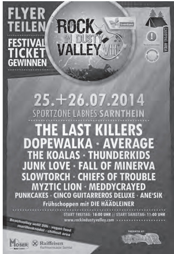
Abb. 5: Festival-Plakat mit Unterstützer-Logo