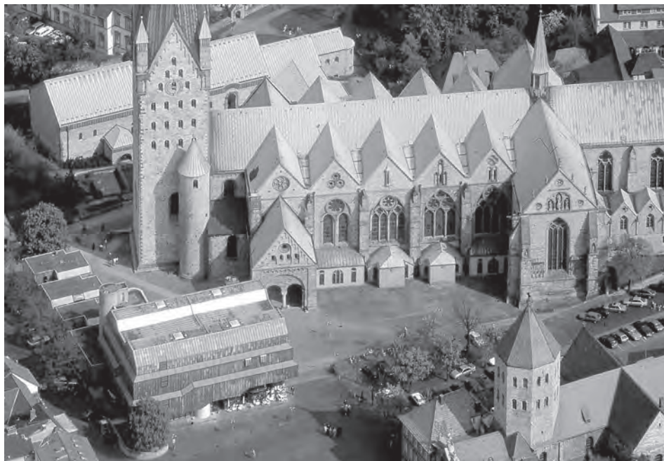
Abb. 4: Lage des Doms, des Diözesanmuseums (vorne links) und des Kaiserpfalz museums (links hinter dem Dom) in der Altstadt von Paderborn; Quelle: Diözesanmuseum Paderborn, Wolfgang Noltenhans.

Dabei waren die Herausforderungen im Erzbischöflichen Diözesanmuseum besonders groß. Das Gebäude wurde Ende der 1960er Jahre geplant und bis 1975 errichtet – eine Erbauungszeit, in der die Themen „Barrierefreiheit“ und Design für Alle noch kaum eine Rolle spielten. Demzufolge weist das Museum heute in diesen Bereichen große Defizite auf (vgl. Abb. 5 u. 6), die im Hinblick auf die gewandelten Anforderungsprofile (bedingt durch den demographischen Wandel, gesteigerte Besucherzahlen und den Ausbau des museumspädagogischen Programms etc.) inzwischen nicht mehr akzeptabel sind und bereits zu negativen Reaktionen der Besucher und in der Presse geführt haben.