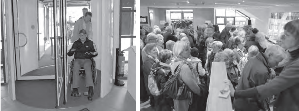
Abb. 5, 6: Herausforderungen an die barrierefreie Zugänglichkeit des Diözesanmuseums Paderborn; Quelle: NeumannConsult/Diözesanmuseum Paderborn, Wolfgang Noltenhans.

worden. Diese erfolgte in Form einer zweitägigen Inhouse-Schulung unter Beteiligung der Diözesanbaumeisterin, die sich das Thema von Anfang an zur Chefsache gemacht hat.