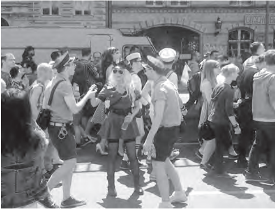
Abb. 6: Christopher Street Day (CSD) in Berlin 2012; Foto: W. Kaschuba.

Art von lokaler Kultur- und Konsumpromenade zu fungieren, die eben auch ein Stück neuer „öffentlicher“ Raumqualität produziert. Dem folgt die Festivalisierung der 1970er Jahre, also die Einrichtung von alljährlichen Musik-, Film- und Literaturveranstaltungen auf dem Marktplatz oder in der Fußgängerzone, die der Stadtkultur neue internationale wie jugendkulturelle Impulse verleihen soll. Parallel dazu wird eine nachhaltige Institutionalisierung der Kultur vorangetrieben, indem die Innenstädte mit neuen oder renovierten Kulturbauten überzogen werden in Gestalt von Stadt- und Kunstmuseen, von Kulturscheunen und Musikspeichern samt „kulturpflegerischem“ Personal. Davon zeugen heute fast 7.000 kommunale Museen in deutschen Städten, dazu zahllose Jugendclubs wie Seniorentreffs, aber auch die rund 700 alten wie neuen deutschen Stadttheater, die Hälfte aller kommunalen Theater weltweit. In den 1990ern dann schließt sich die Eventisierung der Stadtkultur an, also die systematische Inszenierung von urbanen Großereignissen wie Stadtfesten, Konzerten, Partys, Feuerwerken – gedacht als Attraktion zugleich für Touristen wie Einheimische (vgl. Abb. 6).