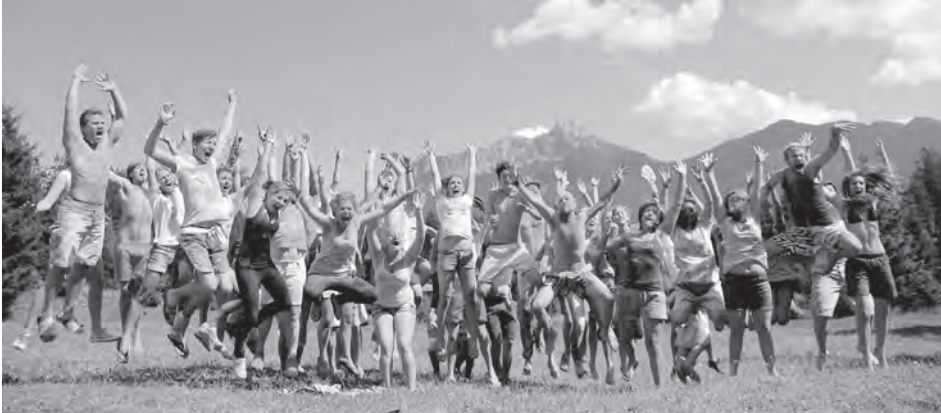
Abb. 8: Jugendprojekt »af zack.« Alkoholfreie Sommerfreizeit in den Bergen; Quelle: Forum Prävention .

auszutauschen. Durch regelmäßige Posts werden die User dazu aufgefordert, sich mit ihren Meinungen und Erfahrungen an den Diskussionen zu beteiligen und ihre Sicht der Dinge darzulegen. Gleichzeitig soll aber auch eine Dialogmöglichkeit zwischen den Generationen geschaffen werden. Im Mittelpunkt stehen dabei Fragen wie: „Geht es den Jungen nur ums Trinken bis zum Umfallen und den Erwachsenen ums Verbieten?“