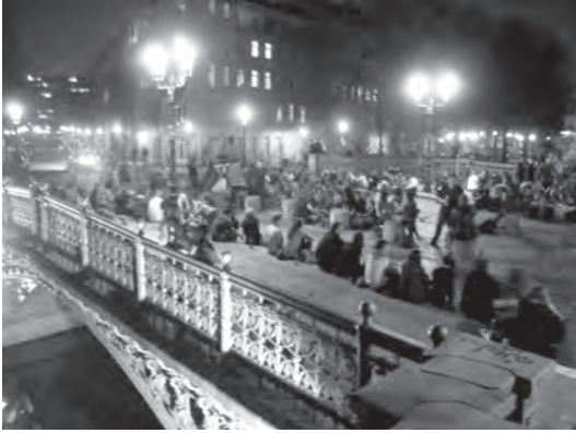
Abb. 2: Admiralbrücke bei Tag in Berlin 2014

Kein Wunder jedenfalls, dass viele Anwohner diese Brückenpartys nicht wirklich lustig und urban fanden. Denn aus ihrer Perspektive als Betroffene verkörperten abendliche Musik und Unterhaltung nur störenden Lärm. Bierflaschen und Coffee to go produzierten nur ärgerliche Müllberge, und die abendlichen Brückenbesetzungen erschienen als eine freche Horde fremder Eindringlinge. Also wurden mit Plakaten und Aushängen mehr oder weniger dezente Hinweise auf die eigenen Bedürfnisse gegeben: „Wir