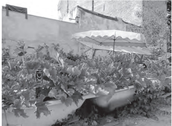
Abb. 2: Nachbarschaftsgarten Prachttomate, Berlin-Neukölln; Foto: stadtforschen.de .

Aktivitäten von Gärtnerinnen und Gärtnern strahlen so weit in die angrenzenden Quartiere, dass die Projekte von einer Berliner Gärtnerin als „Draußen-Stadtteilzentren“ bezeichnet werden (vgl. Abb. 2).