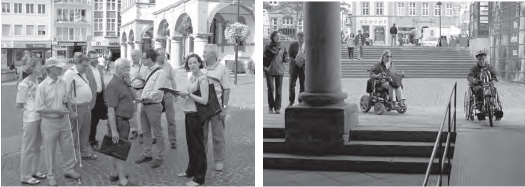
Abb. 2, 3: Altstadtbegehungen mit verschiedenen Interessenvertretern; Fotos: NeumannConsult.

fügbaren finanziellen Ressourcen – schrittweise Defizite beseitigt und Synergieeffekte bei anstehenden Bauvorhaben genutzt werden.