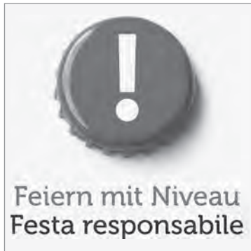
Abb. 4: Unterstützer-Logo; Quelle: Forum Prävention .