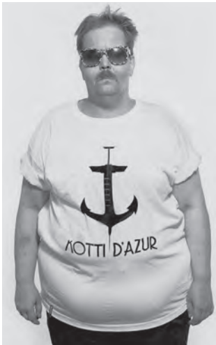
Abb. 9: Kotti d'Azur dick. Berlin 2012; Foto: muschi kreuzberg .