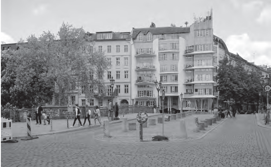
Abb. 1: Admiralbrücke bei Tag in Berlin 2014; Foto: W. Kaschuba .

auch „gelungene“ Urbanität werden kann. Viele meiner Beispiele und Bilder stammen dabei aus Berlin, stehen damit gewiss aber nicht nur für dortige lokale, sondern in vieler Hinsicht für generelle Entwicklungen urbaner Räume.