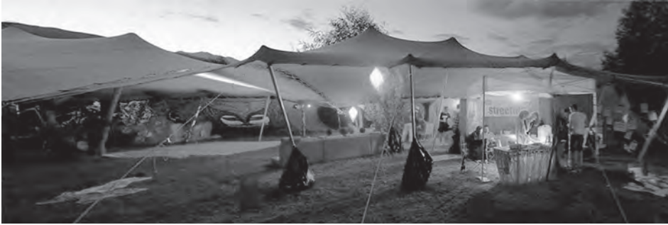
Abb. 6: Projekt »streetlive« der Caritas als mobile Interventionsform; Quelle: Caritas Diözese Bozen-Brixen.

ten. Die Streetworker haben einen telefonischen direkten Kontakt zur Einsatzzentrale der Polizei, um diese bei schwerwiegenden Gewaltsituationen rasch an Ort und Stelle zu haben. Andererseits lösen sich viele Konflikte aber auch durch die reine Präsenz und das Wissen über die Abläufe und Dynamiken des Platzes. Zudem finden einmal im Monat verschiedene spielerische und unterhaltsame Aktivitäten am Obstplatz statt, die die Platzbesucher einbeziehen. Zusätzlich kommen Mediationsaufgaben dazu, wie zum Beispiel die Vermittlung zwischen den einzelnen Interessensgruppen: Anwohner, Geschäftsinhaber und Obststandbesitzer. Seit Beginn des Projekts im Frühjahr 2013 sind die Problemsituationen und Klagen deutlich zurückgegangen.