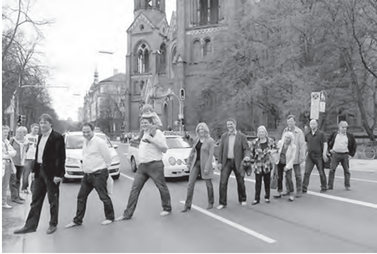
Abb. 5: Auf dem Weg zum Isarboulevard: Unter anderen unterstützte die OB-Kandidatin der Grünen die urbanauten und demonstrierte gemeinsam mit ihnen für die Einschränkung des Verkehrs; Foto: die urbanauten , München.

Die urbanauten aber bleiben hartnäckig: Mit Straßenfestivitäten, besonderen Aktionen und eigens dafür beantragten temporären Sperrungen haben sie es den Bürgerinnen und Bürgern ermöglicht, einen „Isar-Boulevard“ zumindest zeitweilig erleben zu dürfen. Die dauerhafte Verkehrsberuhigung bleibt weiterhin ein Ziel, wofür Unterstützung durch verschiedene, einflussreiche Akteure bereits gewonnen werden konnte (vgl. Abb. 5).