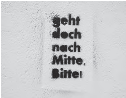
Abb. 3: Geht doch nach Mitte bitte – Berlin 2013; Foto: W. Kaschuba.

Drittens „lernen“ wir an und von solchen Beispielen offenbar alle etwas, manche weniger, manche mehr. Wir lernen, dass der Konflikt von uns zunächst als Ärgernis erlebt, in Konfrontationen gedacht und in Stereotypen eingeordnet wird: Die Anwohner betrachten hier die Anderen auf der Brücke als Partyvolk, Touristen, Nachtschwärmer und notfalls auch als Fremde mit migrantischem Hintergrund, während die Brücken-