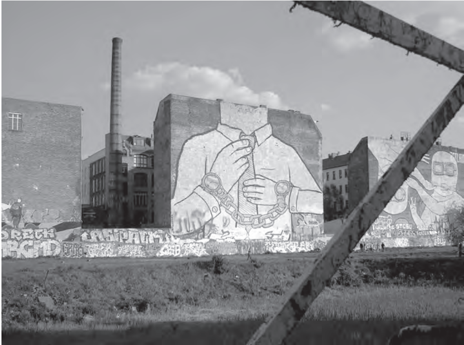
Abb. 13: Mann mit Handschellen, Berlin 2013; Foto: W. Kaschuba.

mer als Anhänger der Urban Art fühlten, betrachten mit fortschreitendem Alter dann doch manches Graffiti an der frisch geweißten eigenen Hauswand nicht mehr wirklich als Kunst, sondern bloß noch als Schmiererei (sagen das jedoch nicht laut, sondern nur leise zu ihrem Hausmeister).