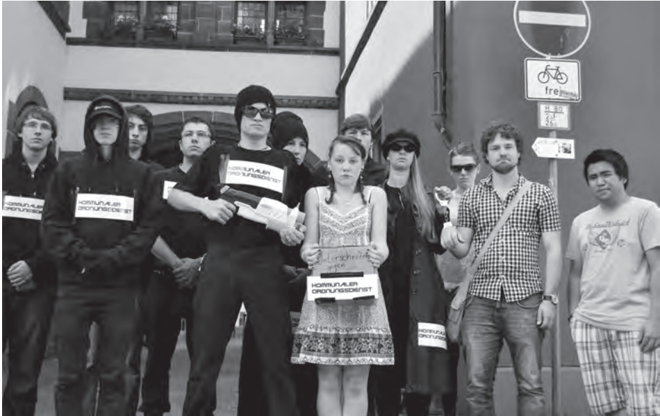
Abb. 1: Unterschriftenaktion gegen einen Kommunalen Ordnungsdienst in Freiburg

in der Regel die unmittelbaren Anwohner an den Aufenthaltsorten der einzelnen Szenen. Den Bedürfnissen der Betroffenen stehen die Wünsche der Feiernden gegenüber, die sich auf den Partys ausleben wollen und die sich ihrerseits gegen einschränkende kommunale Maßnahmen wehren. Die Stadt Freiburg verzichtet inzwischen auf Partywerbung auf ihren Webseiten und hat den kommunalen Ordnungsdienst (KOD) an den einschlägigen Partystandorten verstärkt. Dagegen hat sich eine Bürgerinitiative „Pro Nachtleben Freiburg“ gebildet, die am 01.08.2014 meldet: