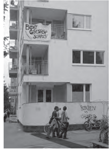
Abb. 12: Haus Reichenberger Straße, Berlin 2013; Foto: W. Kaschuba.